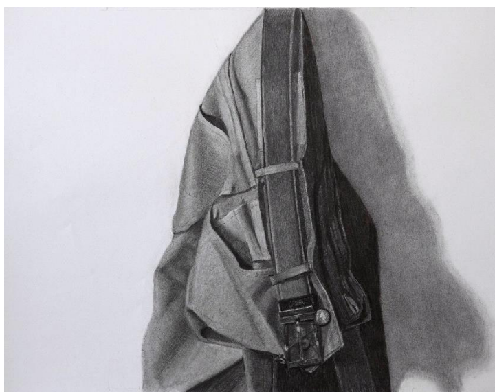
Jacob Hoff, U.t., kul på papir, 40 x 52 cm, 2020

ALLE nødvendige materialer (inkl. pensler, paletter osv.) er til stede på kursusstedet. Det eneste, du skal medbringe, er malegnet tøj og en madpakke.