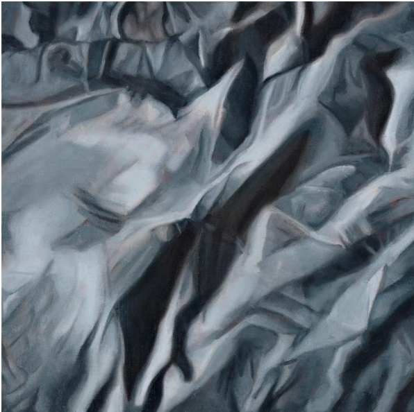
Jacob Hoff, Et hjemligt terræn (Et hjemligt terræn #1), olie på lærred, 50 x 50 cm, 2018.

Du er meget velkommen til at ringe til mig på 20 93 83 93, hvis du har spørgsmål til kursets indhold.