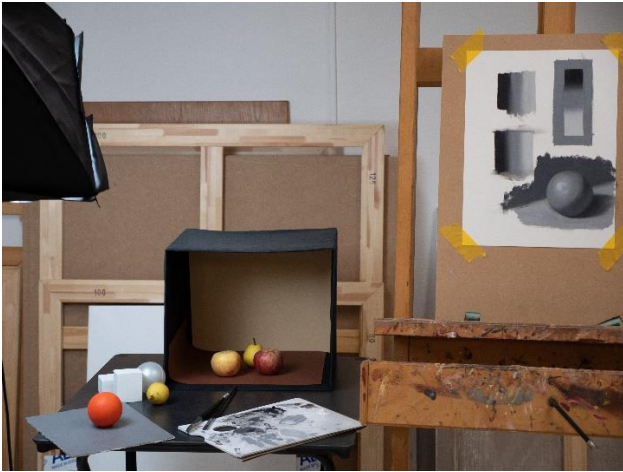
Et snapshot fra kursusforberedelserne.

Snart bliver der også mulighed for at tilmelde sig forårets kurser. Jeg gentager kurserne "Bland den rigtige farve", "Intro til oliemaling" og "Skygger og magi", som I har vist rigtig stor interesse. Desuden kommer der et 5-dages kursus i figurativt maleri i uge 7. Det kommer til at fokusere på stillebenmaleri dvs. maleri af opstillinger. Vi skal kigge på denne klassiske genre i forhold til både tradition og spritnyt samtidsmaleri. Jeg glæder mig allerede! Kurserne bliver slået op på hjemmesiden i løbet af de næste par uger.